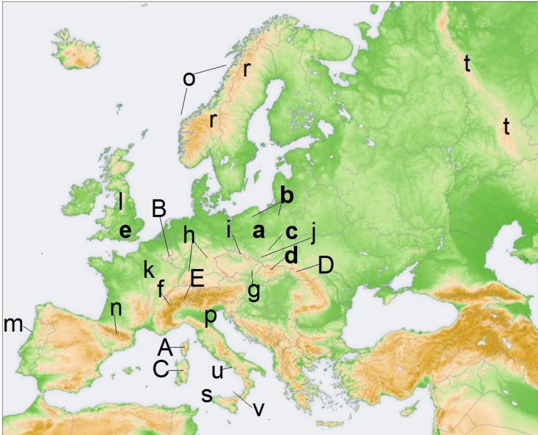
Tájak és vízrajz