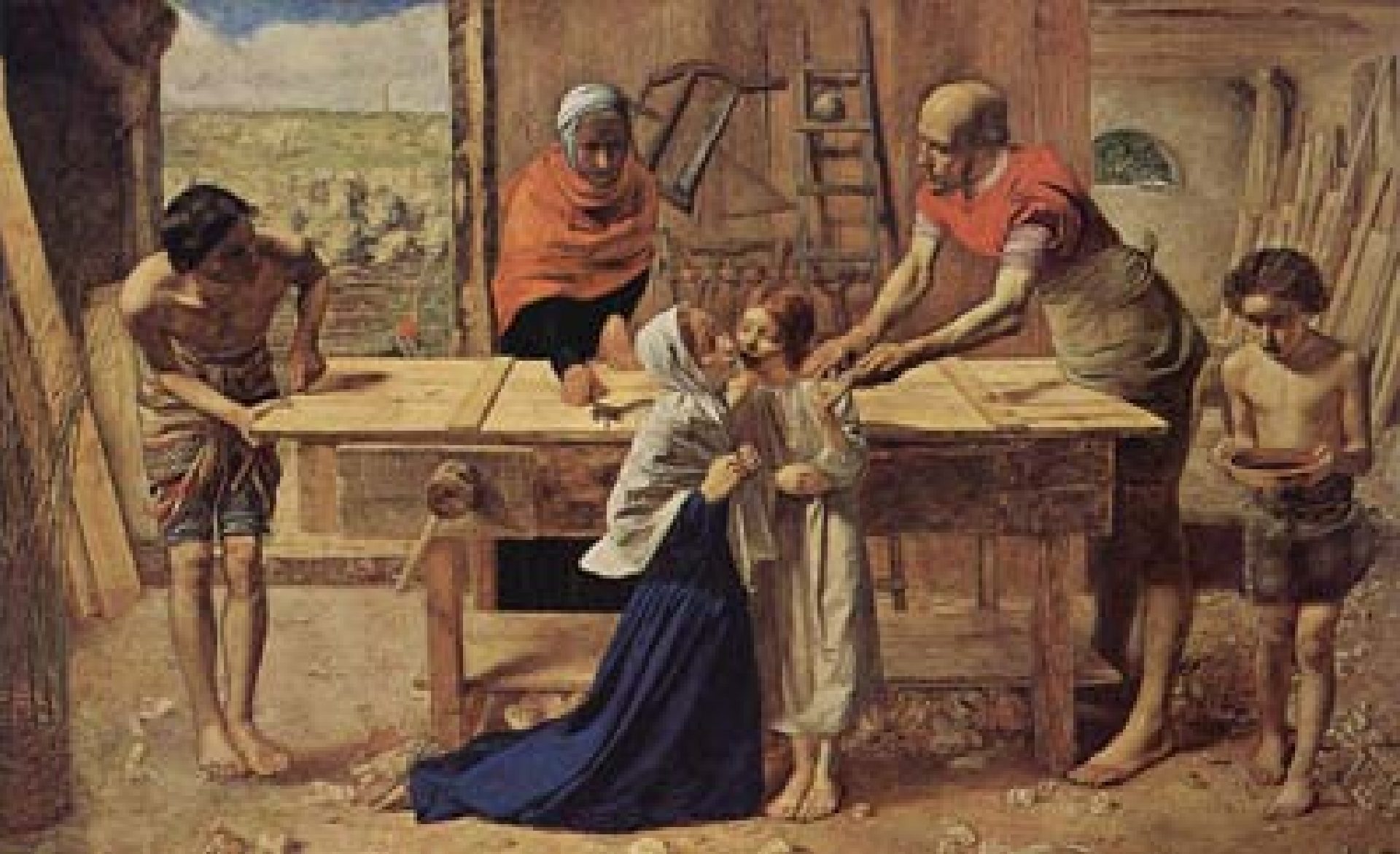
John Millais Everett: Asztalosműhelyből, 1850