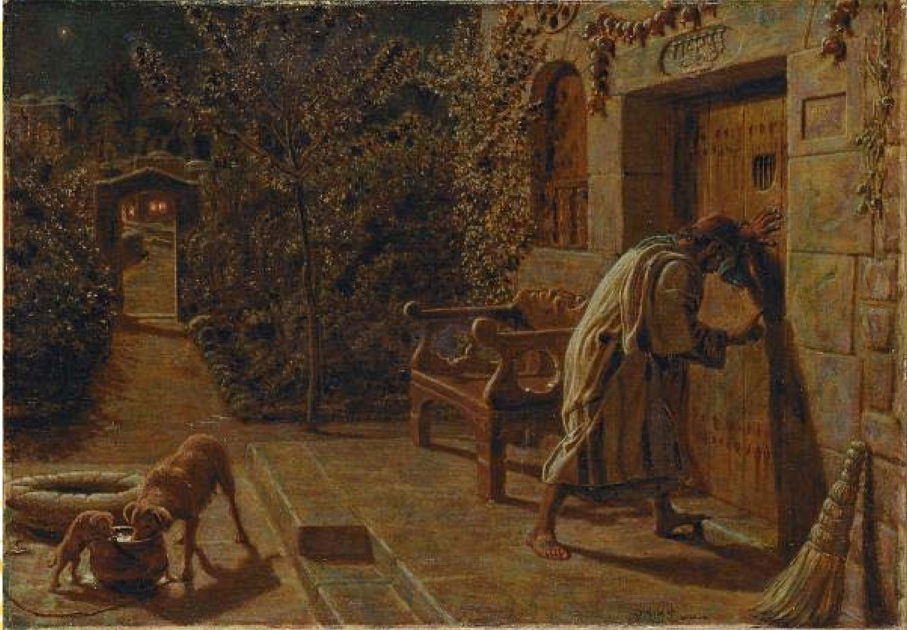
William Holman Hunt: Bosszantó szomszéd