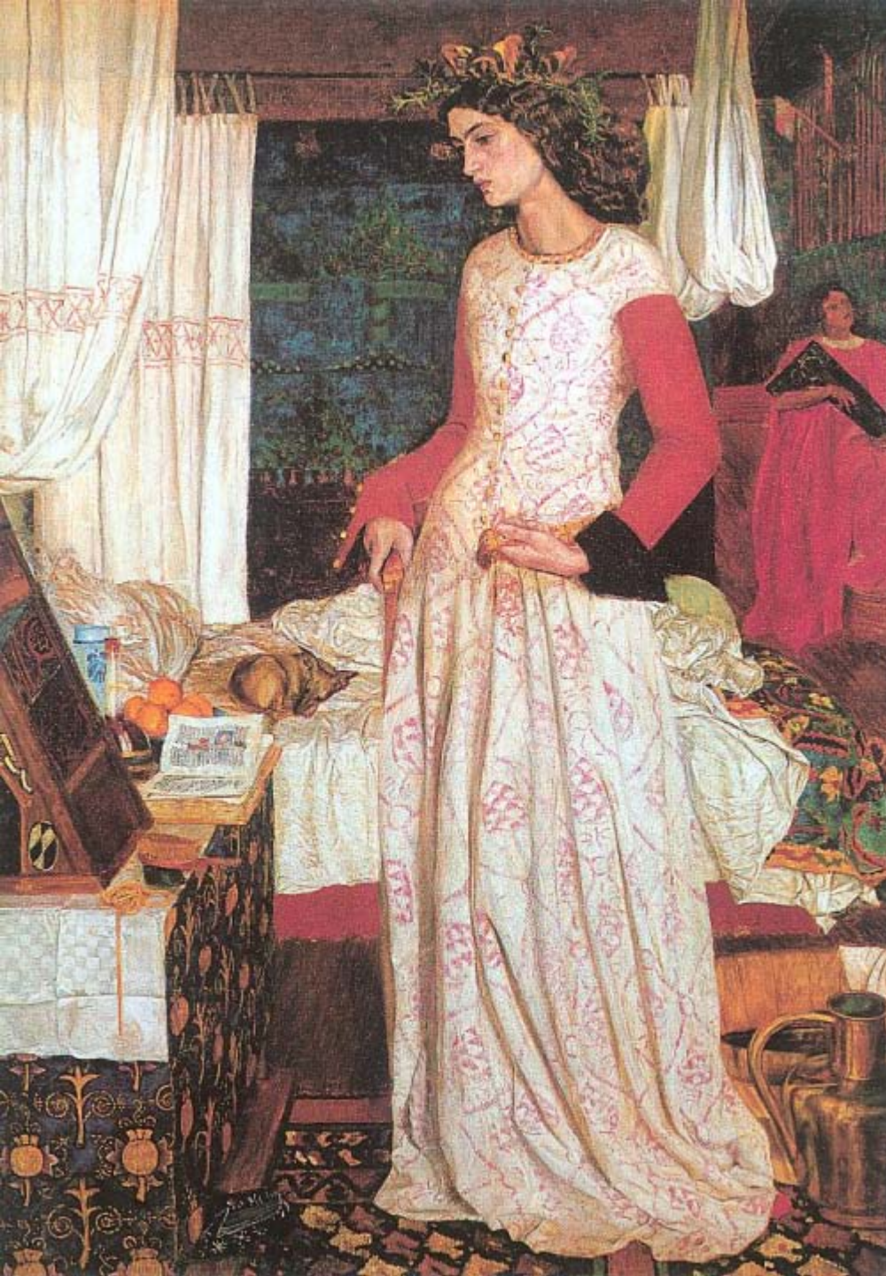
William Morris: Guinevere királyné